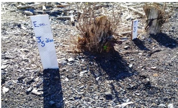
Imagen 1. Comportamiento del Tratamiento 3, a los 35 y 42 días.